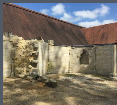
Chœur et absidioles réalisé en 2018