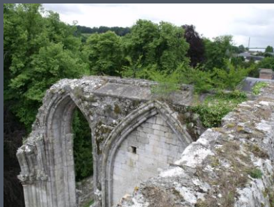
Transept Nord réalisé en 2016

UN PROJET EN 3 PHASES DONT 2 DÉJÀ RÉALISÉES