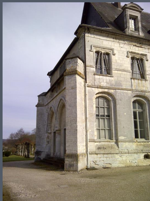
L'extrémité du bâtiment, bien fragilisée.

Différentes options sont envisagées : soit une restitution à l'identique des volumes et façades de l'architecture mauriste, soit une création contemporaine de qualité reprenant la volumétrie originelle des bâtiments.